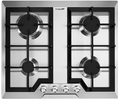
Table de cuisson Elettra